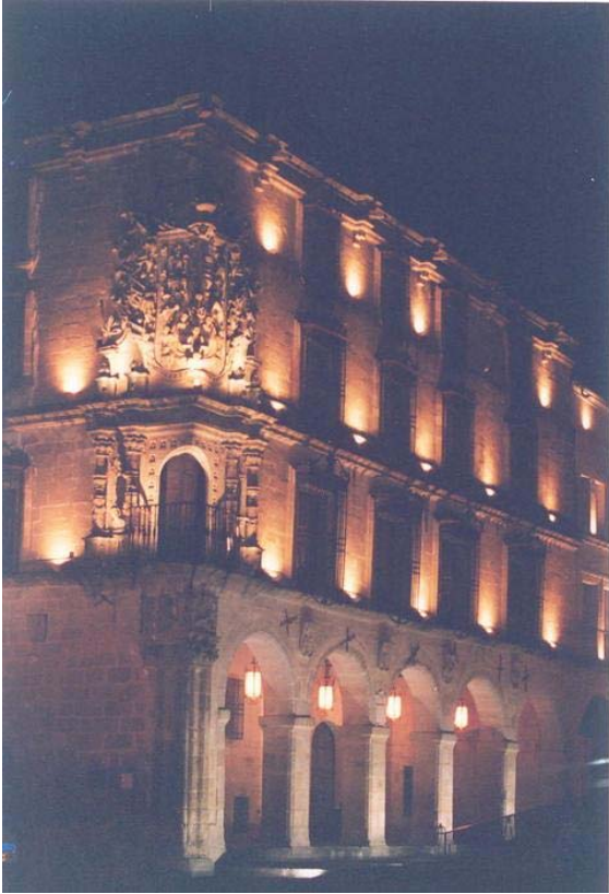
PALACIO DE TRUJILLO