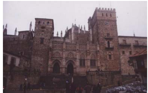
MONASTERIO DE GUADALUPE