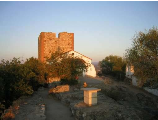
PARQUE NATURAL DE MONTFRAGÜE