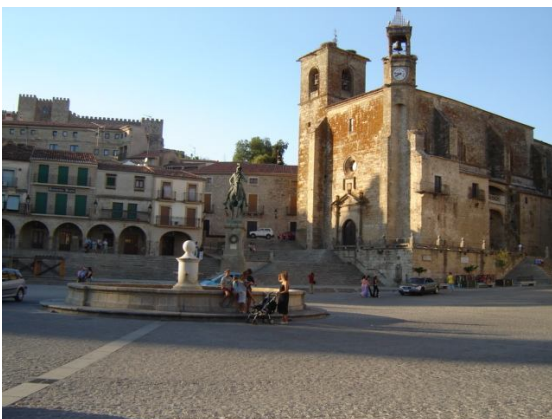
PLAZA MAYOR DE TRUJILLO